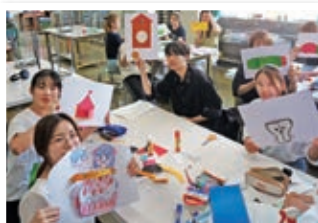
認定絵本土養成講座

2024年度より新しく「認定絵本土」の資格が取得出来るようになりました。「認定絵本土」は、絵本専門士委員会（事務局：国立青少年教育振興機構）が認定する資格です。「認定絵本土養成講座」では、絵本についての幅広く深い「知識」、絵本を活用するための「技能」、絵本の世界を豊かに伝える「感性」の3つの学びを深めていきます。「認定絵本土」は、絵本の楽しさや大切さを広く世に広める役割を担っています。幼稚園や保育園、子ども園や図書館、子育て支援センターや福祉施設などで、読み聞かせや「おはなし会」を開催するなど、資格を活かした活躍が期待できます。 ※写真は今年度1期生の授業の様子です。