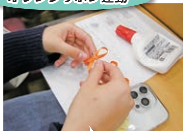
オレンジリボン運動

11月は「児童虐待防止推進月間」で、国や自治体だけではなく学校・民間企業などさまざまな機関がこの主旨に賛同し、運動を展開しています。オレンジリボンには「児童虐待防止」という思いが込められています。多くの人に子どもの虐待問題に関心をもってもらい、子どもの笑顔を守るために何が出来ののかを呼びかけ、子どもの虐待が起こりにくい社会を目指しているのが「オレンジリボン運動」です。本学では、この主旨に賛同し、「オレンジリボン」を作成しています。